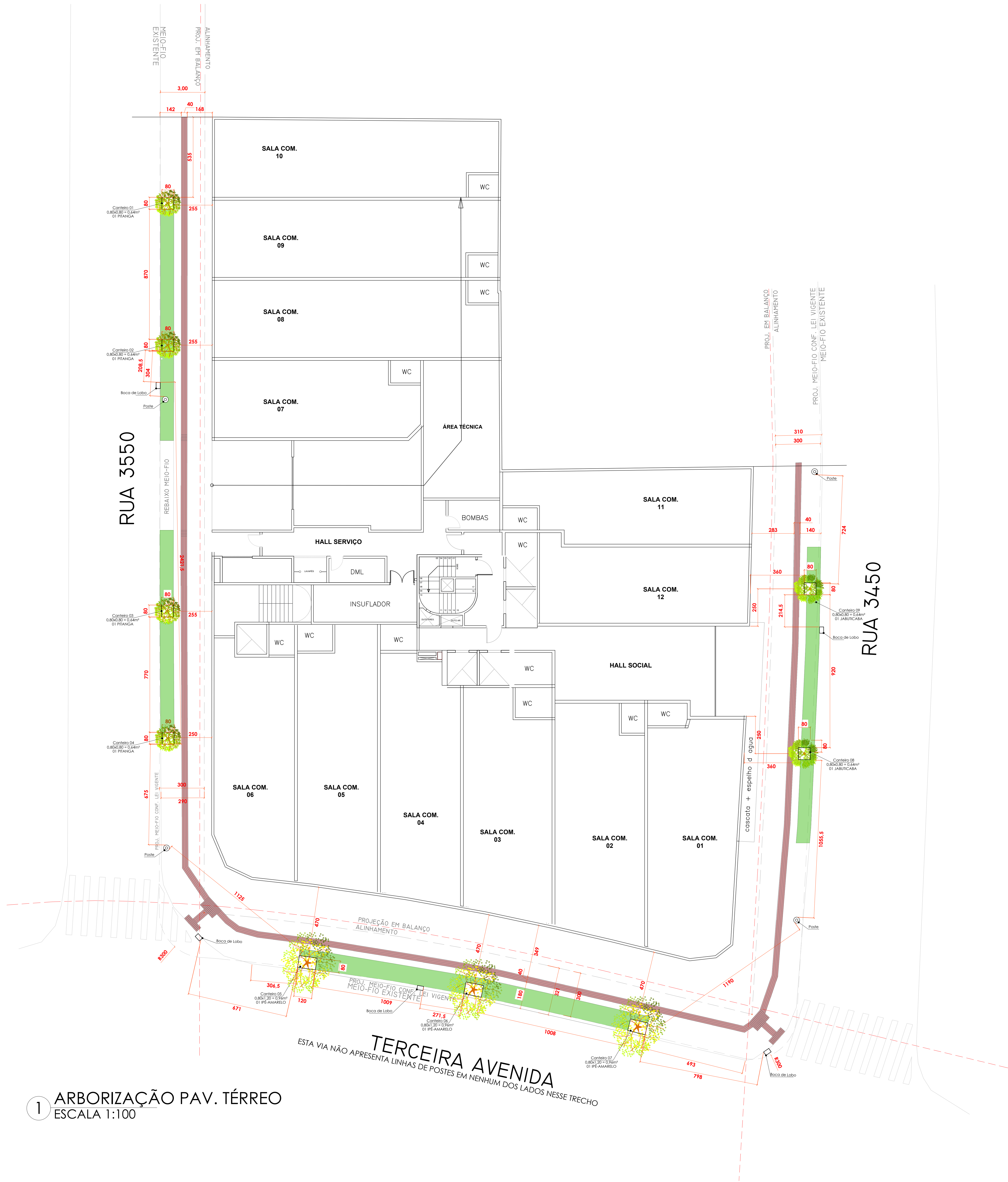
1 ARBORIZAÇÃO PAV. TÉRREO ESCALA 1:100